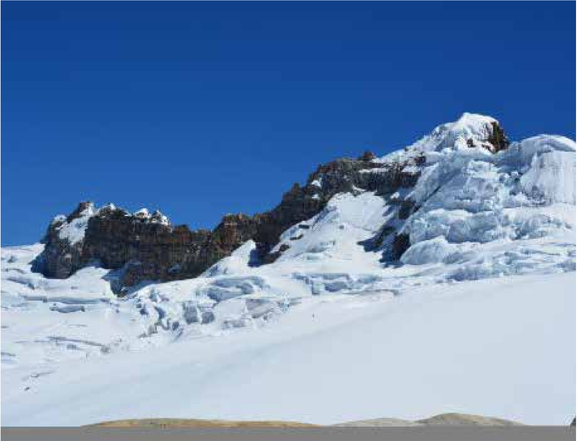
Sierra Nevada de Güicán, en el parque nacional del Cocuy.

de los 500 mil al millón de pesos. Pero vale la pena. Ecoturismo y geológica de viaje están a la orden del día. Y además lo que tiene que ver con las basuras. Hay vigilancia sobre los residuos que deben ser controlados por paseantes y habitantes locales.