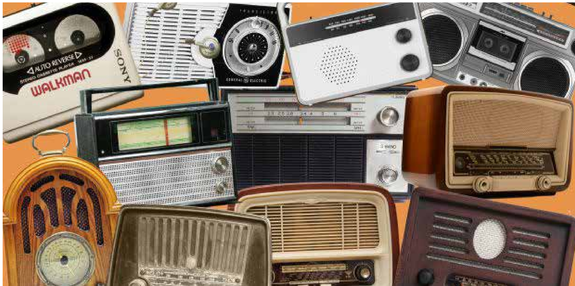
Los radios de los años 60