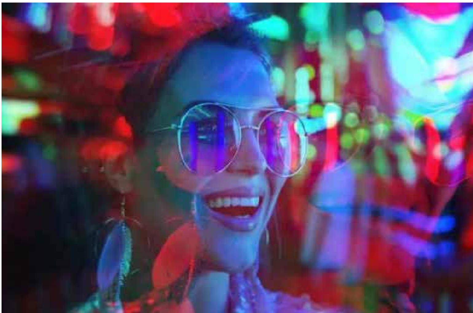
Los consumidores de estas drogas no tienen en cuenta que aunque una dosis puede resultar inofensiva, realmente no saben a qué se exponen.