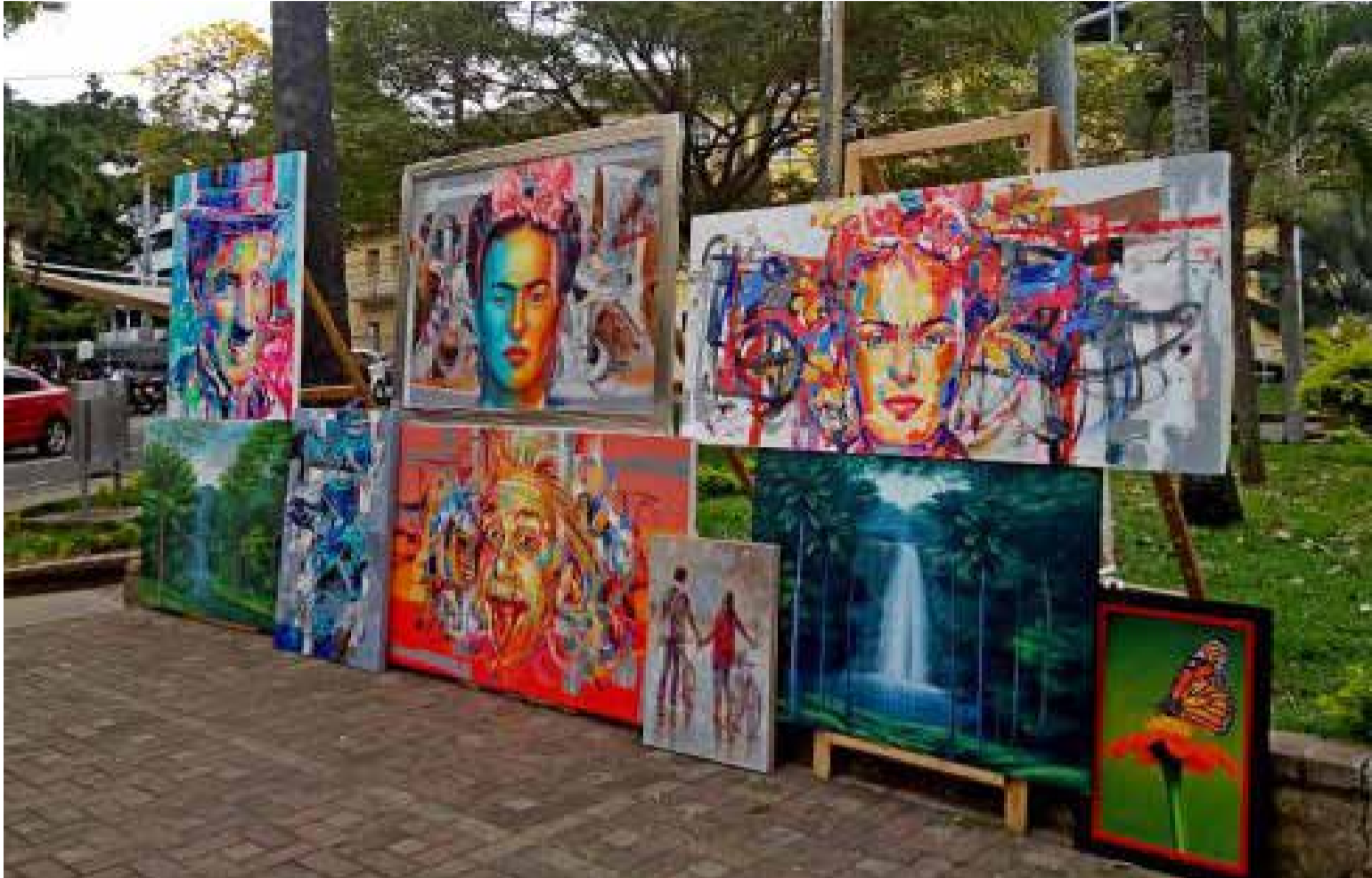
El cuadro de Frida es el más apetecido en el Parque El Peñón

zarnos: elegimos un presidente, un secretario, en fin le dimos sentido y organización al grupo. Inicialmente se llamó Organización del Parque El Peñón».