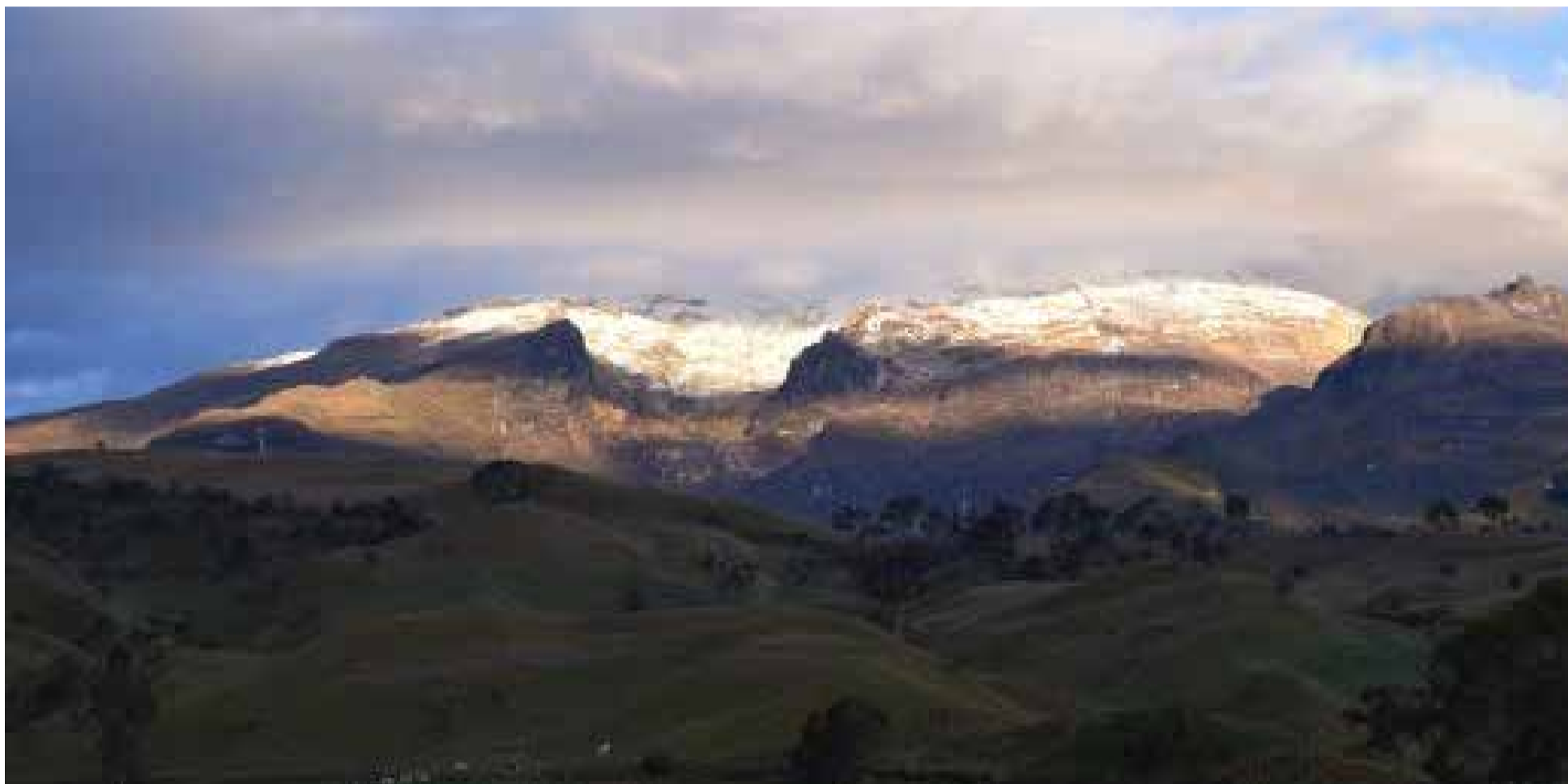
Vista panorámica del Volcán Nevado del Ruiz.