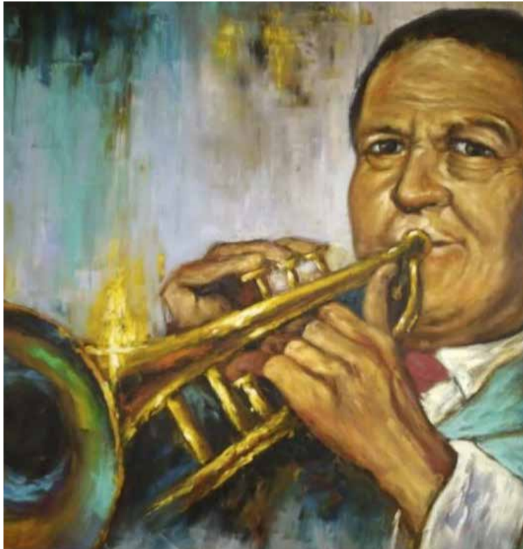
Maestro Pacho Galán

sentido lúdico y la sabiduría criolla y elemental, afloran en sus temas.